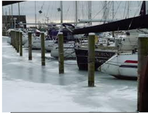
Winter Wonderland ?